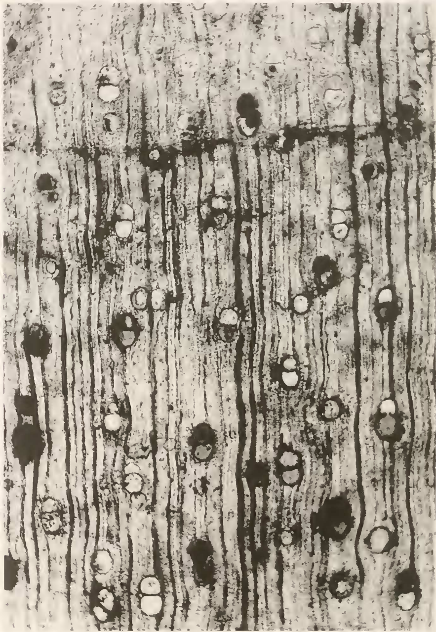
Abb. 6. Carapoxylon cf. xylocarpoides . – Querschliff. Zerstreutporige Gefäße mit dunklen Inhaltsstoffen und marginalem Parenchymband; \times 25 .

G e f ä ß e zerstreutporig, einzeln und radial zu 2–3, rundlich bis oval, häufig mit dunkelbraunen amorphen Substanzen erfüllt, 10–12 Gefäße je mm 2 , Einzelgefäße tangential 90–155 µm, dreiporige z. B. radial 330 µm, tangential 122 µm, Länge der Gefäßelemente 20–570 µm, Gefäße von Fasern oder spärlich von Parenchym umgeben, sonst an Holzstrahlen grenzend, Durchbrechungen einfach, wenig geneigt, Durchbrechungen fast stets mit dunklen amorphen Substanzen belegt, intervaskuläre Tüpfel alternierend, dicht gedrängt, sehr klein, 3–4 µm; Tüpfel der Kreuzungsfelder, soweit erkennbar, wie die der Gefäße.